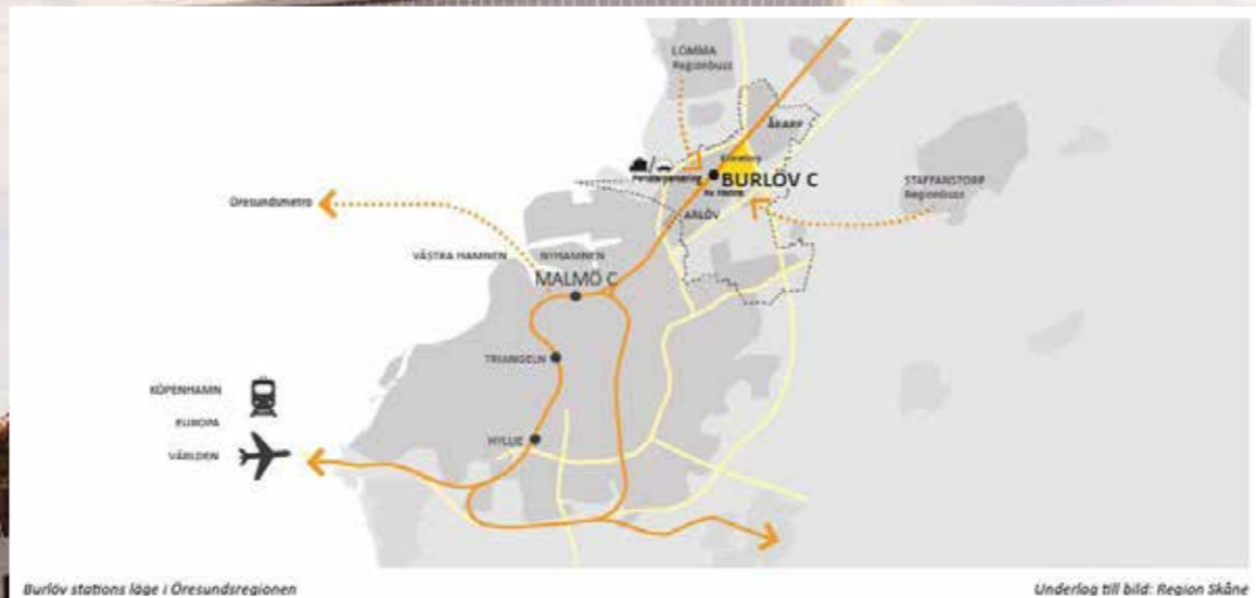
Burlöv stations läge i Öresundsregionen